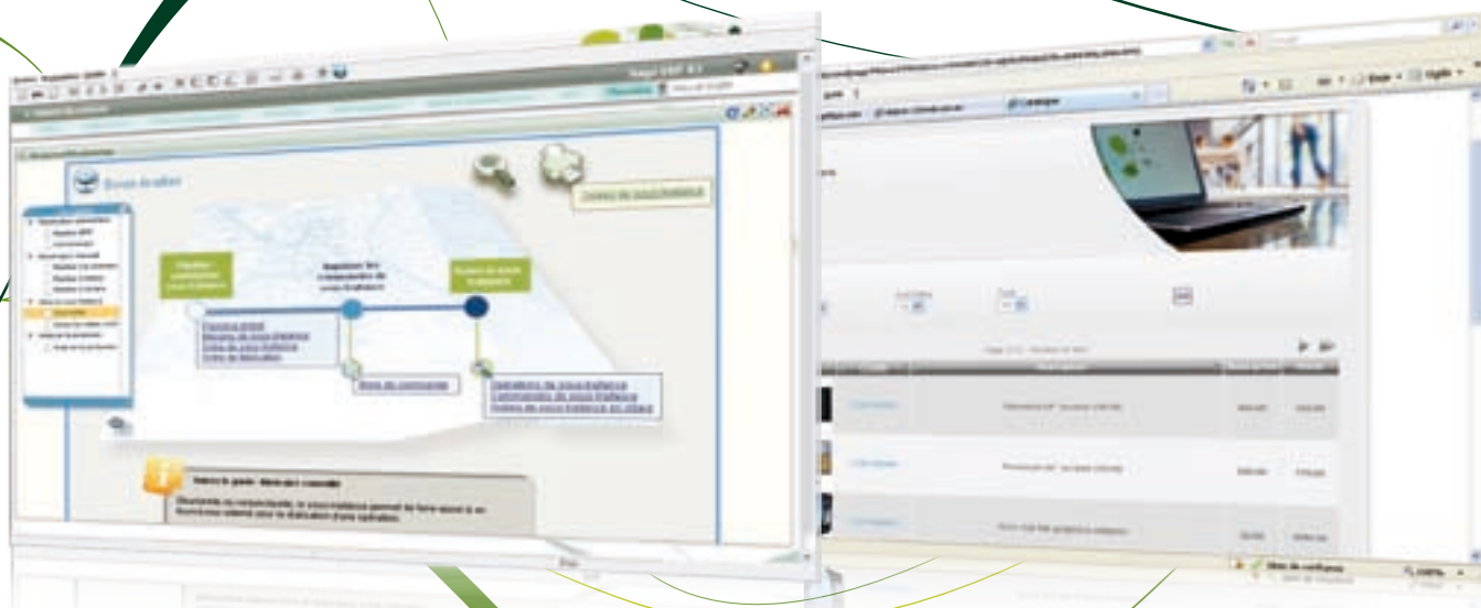
Cet écran illustre un processus de la gestion de la sous-traitance.